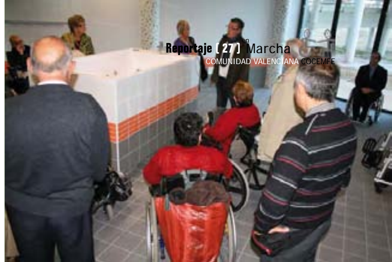
Piscina para fisioterapia.