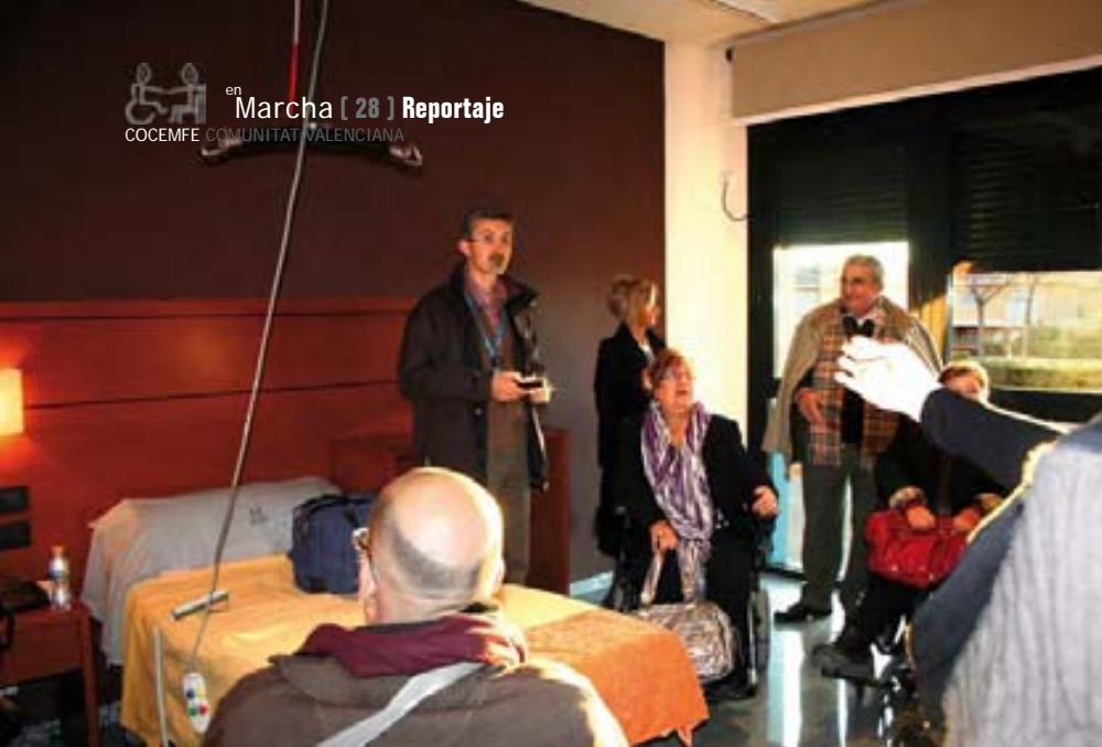
Las habitaciones están equipadas con lo último en domótica.