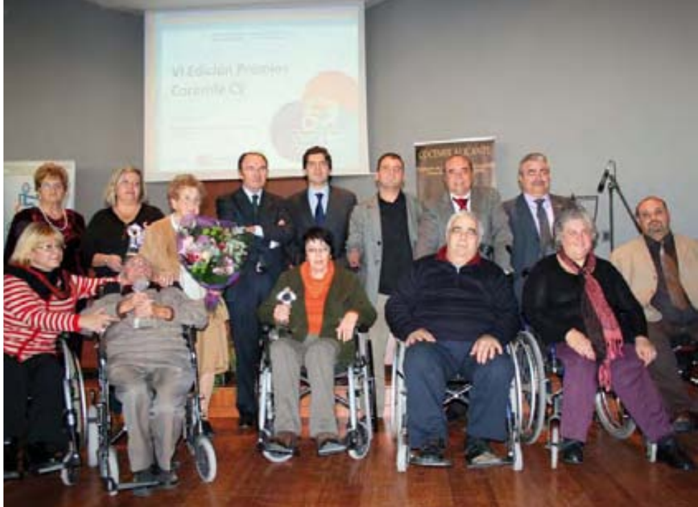
Los premiados, junto a los dirigentes de las federaciones provinciales de Cocemfe CV.

COCEMFE Comunitat Valenciana ha celebrado la VI Convención de Dirigentes de ONG's y los Premios anuales en la Residencia y Centro de Día de Petrer coincidiendo con el Día Internacional de la Discapacidad.