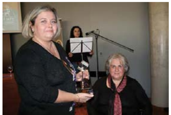
Cavadas no pudo recoger el premio por cuestiones de agenda.