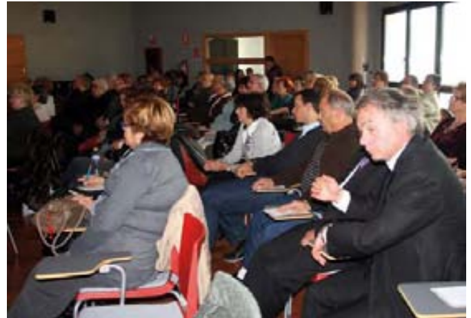
El público llenó el salón de actos del centro.