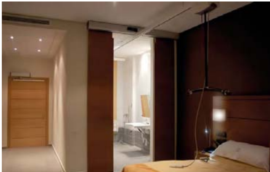
Aspecto de una de las habitaciones.

Biblioteca, una Sala Multimedia-Internet y un Salón de Actos-Sala Polivalente, dotado con todos los adelantos multimedia.