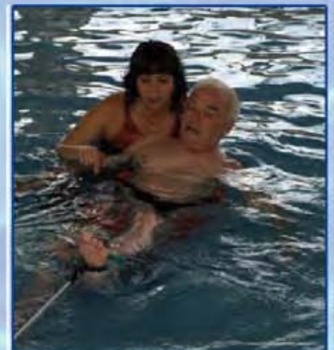
Facilita el trabajo y la comunicación