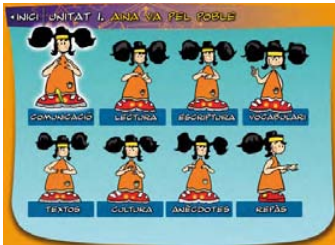
Ilustraciones del proyecto pionero de aprendizaje de valenciano para personas sordas.