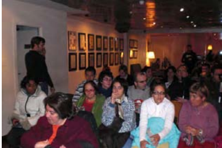
Asistentes a la sesión de la FNAC San Agustín.