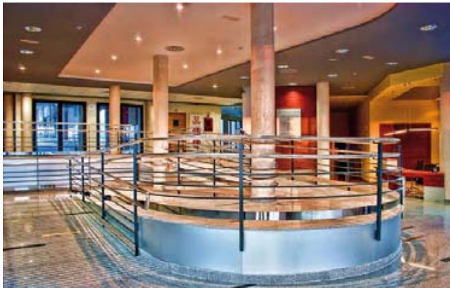
Hall del centro.