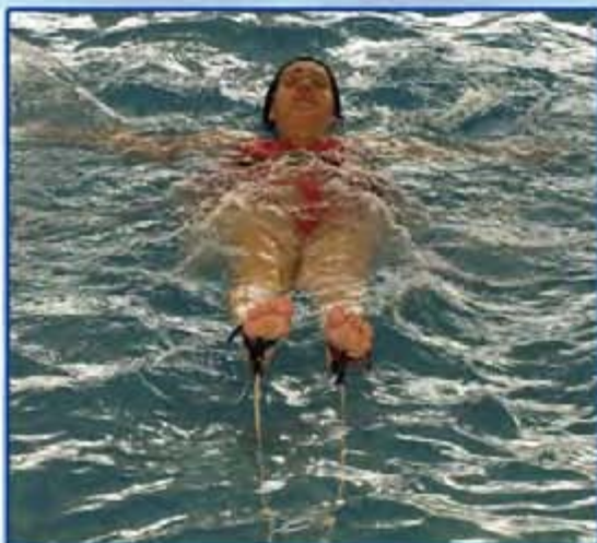
Ejercicio sin desplazamiento