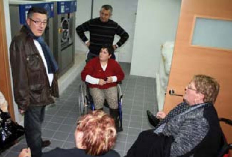
Sala de Lavandería.