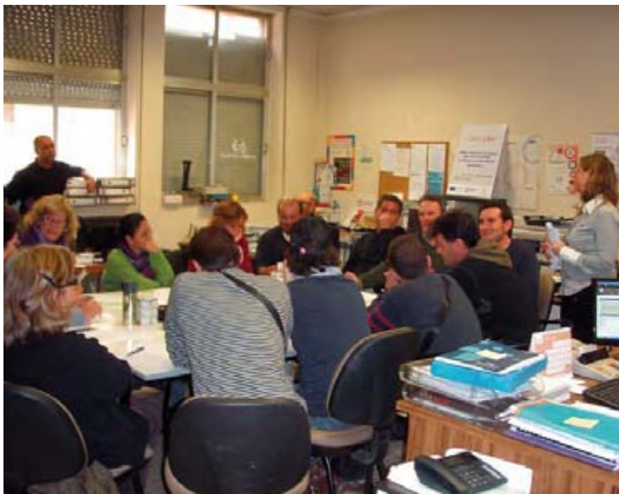
El transporte adaptado tiene como objetivo la mejora de la calidad de vida.

COCEMFE Castellón, a través de su servicio de Transporte