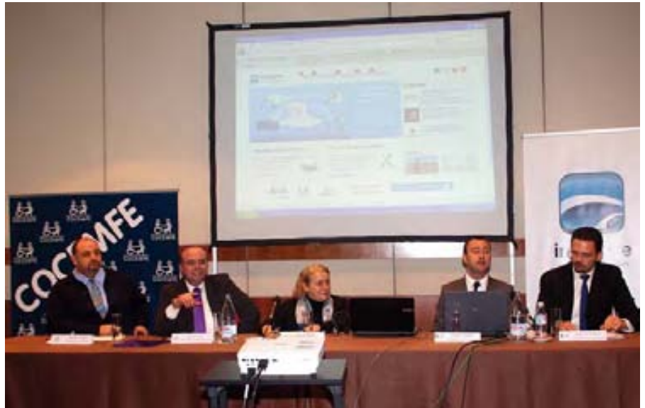
La presentación incluyó una demostración.

El proyecto Inclúsite supone un cambio en la accesibilidad a las tecnologías de la información y la comunicación (TIC), ya que de este modo es el administrador quien garantiza la accesibilidad a los contenidos web y no el