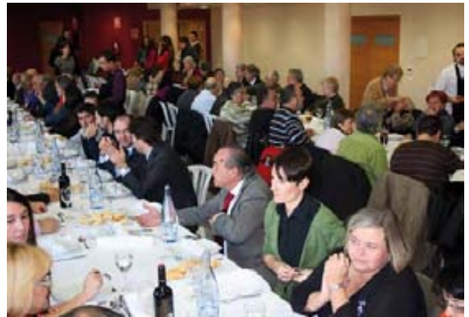
La jornada finalizó con una comida.

falta de plazas para las personas con discapacidad de gran dependencia.