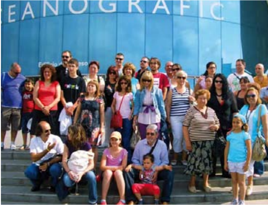
Socios de ADEC visitan l'Oceanogràfic.