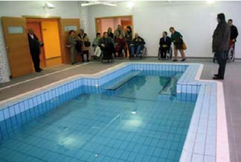
Zona de aguas.