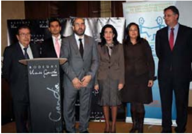
La consellera Angélica Such acudió al acto de presentación.