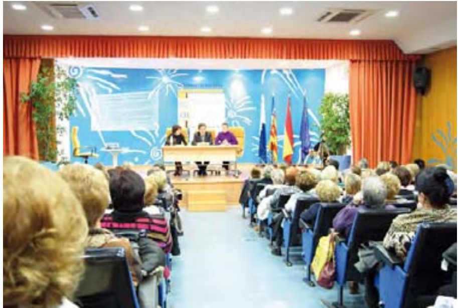
CERMI CV presenta sus propuestas.

“Quiero transmitir que los borradores mejoran sensiblemente la aplicación de la Ley de Autonomía Personal y Atención a Personas en Situación de Dependencia, como, por ejemplo, el hecho de que ya no será incompatible el Centro de Día con una Ayuda a Domicilio”, ha co-