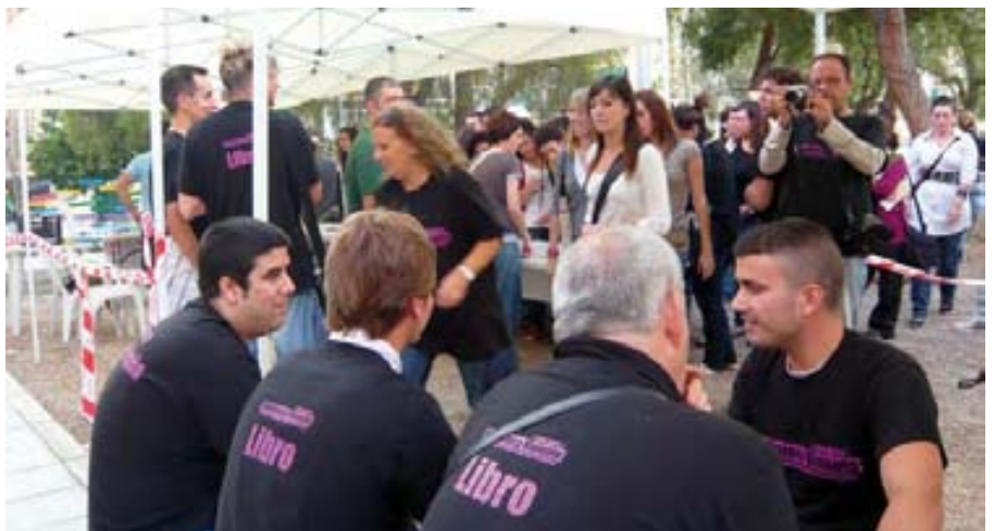
El objetivo es fomentar una imagen real del colectivo.

Este es el segundo año que COCEMFE Alicante participa en este proyecto, gracias a la colaboración de los miembros de la Junta Directiva, quienes abren las páginas del libro de su vida para que el resto de ciudadanos conozcan de primera mano el día a día de una persona con discapacidad, las experiencias y sentimientos vividos. "Me di cuenta de que todos los lectores que me