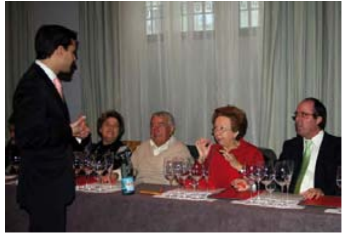
Los asistentes pudieron preguntar sus dudas al sumiller.