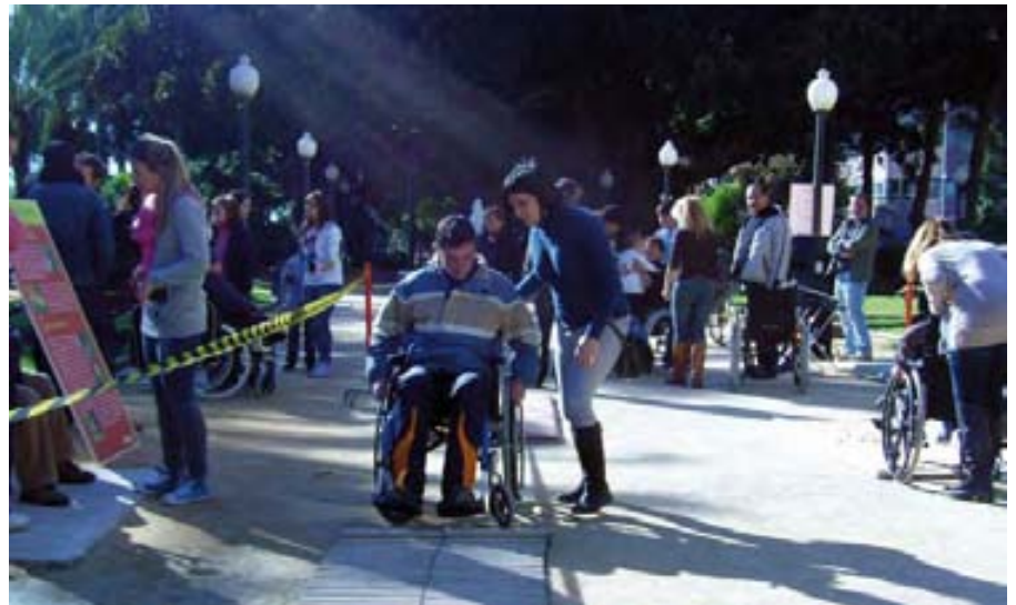
Circuito de obstáculos.

Los viandantes pudieron experimentar las sensaciones de una persona con movilidad reducida al tenerse que enfrentar a los obstáculos que perduran en las calles