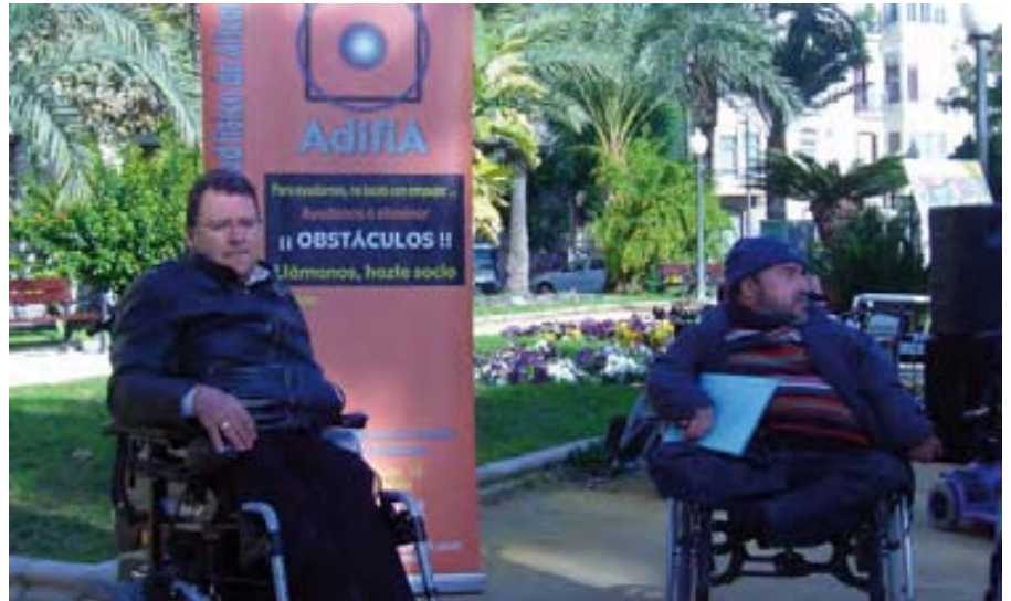
Los miembros de ADIFIA tratan de sensibilizar a la ciudadanía.

El día 4 de diciembre, con un bonito día soleado, a pesar de las bajas temperaturas, los miembros de la asociación salieron a la calle a sensibilizar, a hacer visible al colectivo, y a demostrar en este día, en la calle, los numerosos obstáculos que impiden normalizar la total movilidad como ciudadano de las personas con discapacidad física. Para este fin, se instaló un circuito de obstáculos en el parque de Canalejas, y se invitó a los ciudadanos, paseantes por el lugar, a que se subieran en