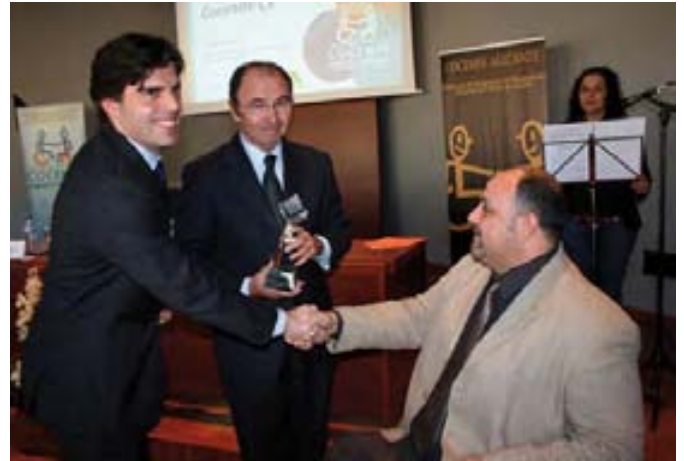
Gestaser ha participado en la construcción de la residencia.

de las Personas con Discapacidad, que tiene por objeto ayudar a entender las cuestiones relacionadas con la discapacidad, como los derechos de los que son titulares o los beneficios que reporta a la sociedad su integración.