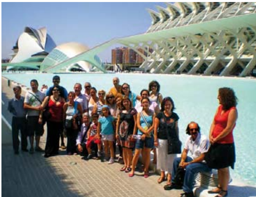
Imagen de una visita a la Ciutat de les Arts i les Ciències.