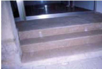
Escalera para salvar.

Por su parte, Cocemfe Maestrat se reunió con el alcalde, Abelardo Ripoll,