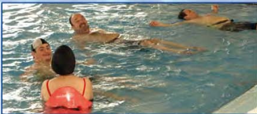
Trabajo en grupo

Para piscinas públicas, privadas o particulares