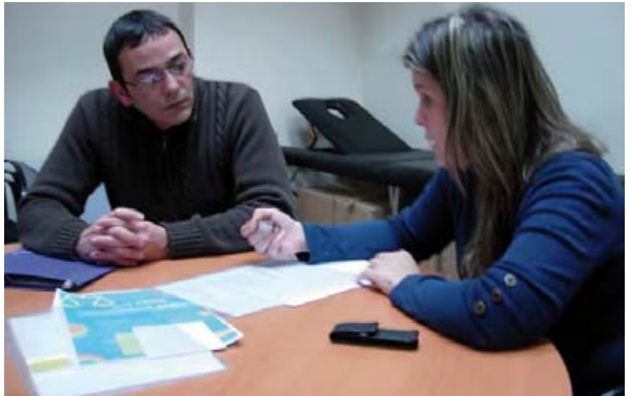
Un usuario del servicio consulta sus dudas.

La entidad ha puesto en marcha esta prestación con el objetivo de que las federaciones provinciales, las asociaciones que forman parte de ellas, y, en última instancia, sus asociados, puedan disponer de un