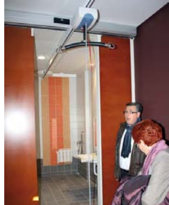
La grúa es controlada por el usuario.

El efecto osmótico. Y, precisamente, el deseo de promover esta vida en común y de que el colectivo de gran dependientes sea visible a la sociedad, ha llevado a Cocemfe Alicante a plantear que los servicios con los que cuenta la residencia como pueden ser el gimnasio, el salón de actos, la lavandería o la piscina climatizada, puedan ser utilizados por personas no residentes, como, por ejemplo, para presentaciones de libros, en el caso del salón de actos. “De esta forma los residentes no están enclaustrados, la gente de fuera nos conoce, nos ve, ya que queremos que sea un sitio en el que los residentes puedan salir y entrar al igual que las personas que no residen”, explica Segura.