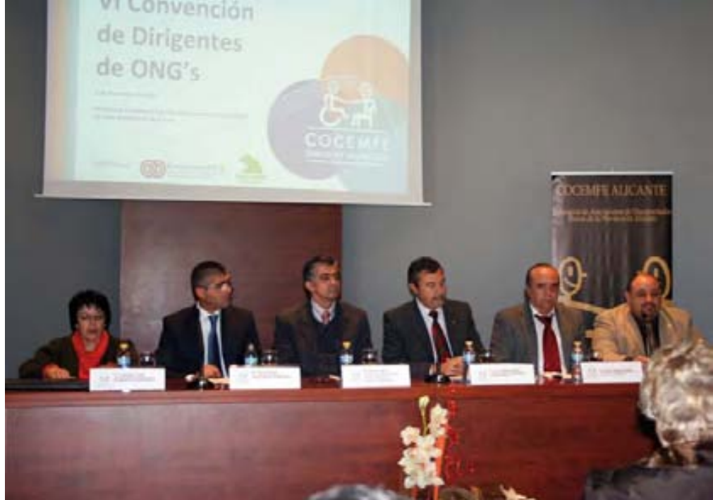
Presentación de la Convención.

La VI Convención de Dirigentes de ONG's reunió a representantes de las 88 entidades integradas en Cocemfe CV. La jornada incluyó una ponencia sobre Educación Inclusiva en los estudios superiores, y finalizó con una visita a las dependencias del centro de Petrer.