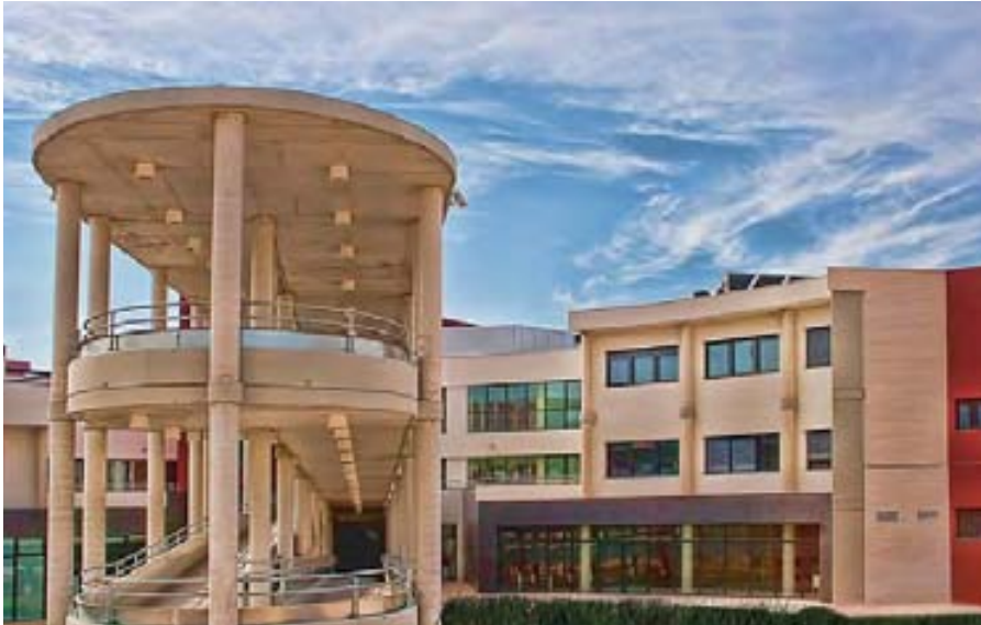
Aspecto de la fachada posterior y las rampas.