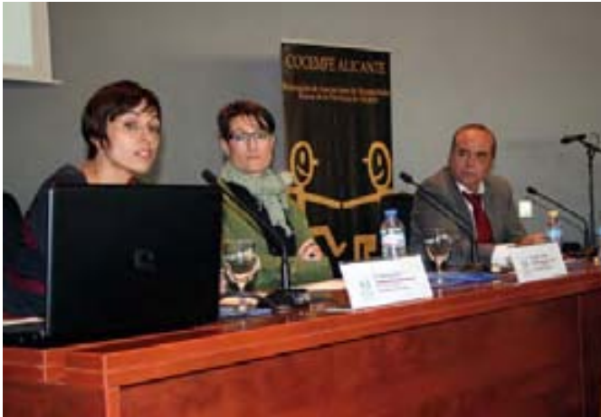
La jornada incluyó una ponencia sobre educación inclusiva.