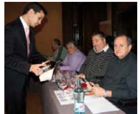
La jornada incluyó una parte teórica y otra práctica.

En esta iniciativa participan 25 personas con distintas capacidades, de alrededor de una decena de asociaciones integradas en Cocemfe CV. De este modo, han asistido personas con movilidad reducida, con problemas de deambulación, con enferme-