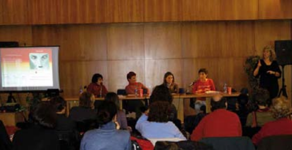
Asistentes a la jornada.