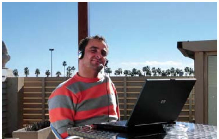
El campeón olímpico Daniel Vidal, usando Inclúsite.

usuario quien ha de adaptar su equipo informático con periféricos y programas especiales. Solo es necesario disponer de un equipo con audio y un micrófono.