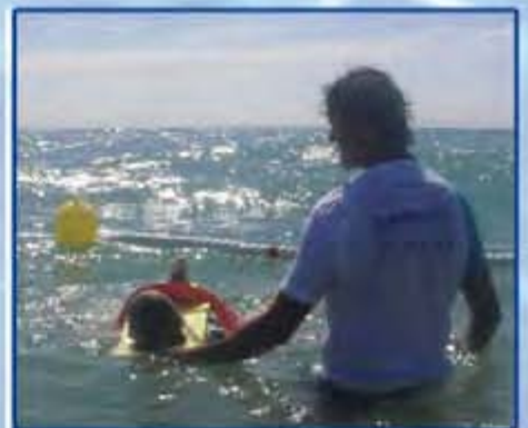
Baño adaptado en playas