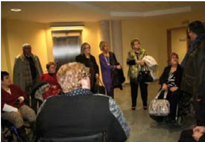
A lo largo del día se realizaron dos visitas guiadas al centro.